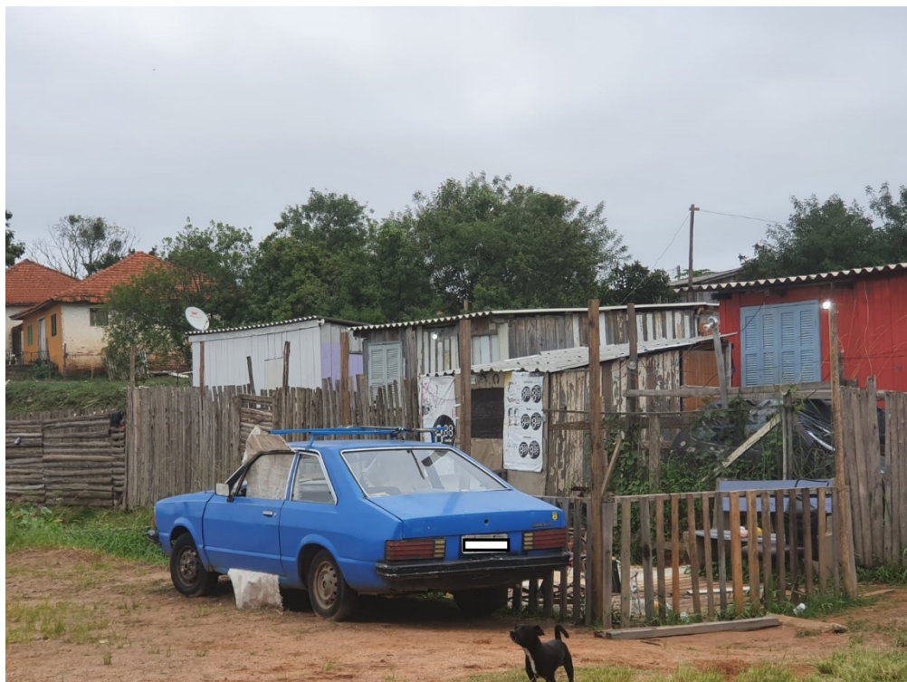
Figura 4: Habitações na área do antigo Jockey Club, bairro Juscelino Kubitschek, abril de 2024.