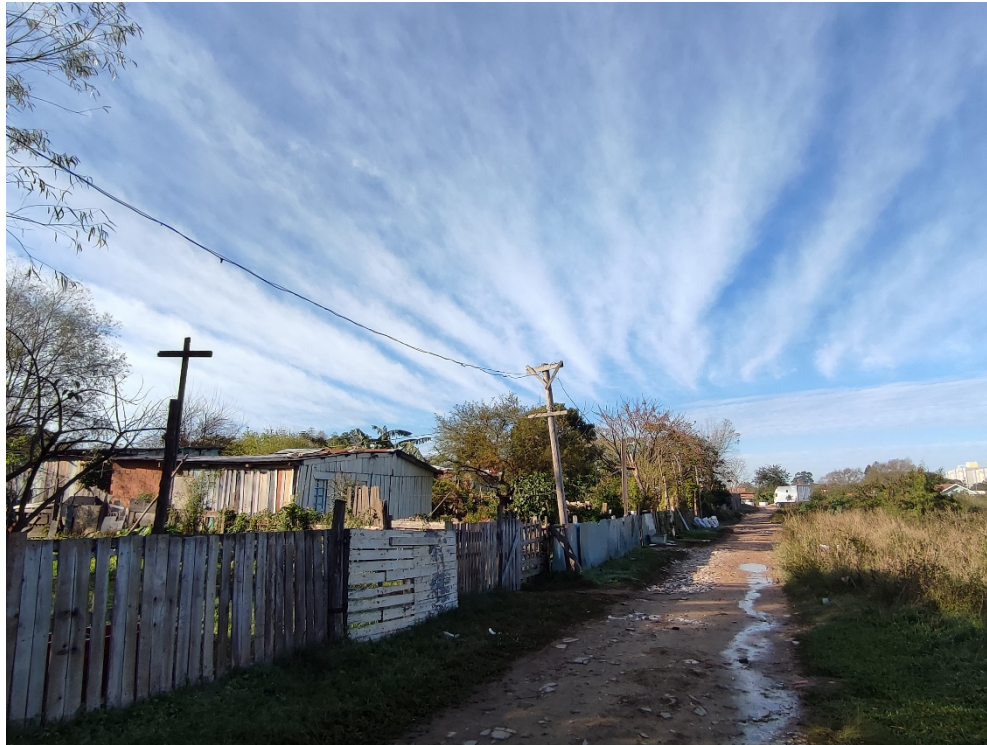
Figura 3: Prolongamento irregular da rua Willy Pereira da Silveira, nas proximidades do Arroio Cadena, bairro Noal, julho de 2023.