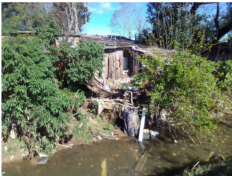
Figura 2: Habitação precária nas margens do Arroio Cancela, bairro Urlândia, julho de 2023.

O território somente existe enquanto usado, como bem disse Milton Santos (2015), com estes usos produzindo as paisagens que observamos nas cidades e, no caso deste texto, nas periferias pobres de Santa Maria. Os trabalhos de campo nos permitiram organizar rico levantamento fotográfico dos usos do território nas áreas de elevada privação social da cidade, muitas das quais expressando a pobreza, a precariedade e a ausência do Estado, fato que se inscreve na paisagem através das ausências. A privação, cabe lembrar, é uma condição social e histórica de ausências, tanto no sentido material, quanto imaterial, que impacta no pleno uso do território pelas pessoas.